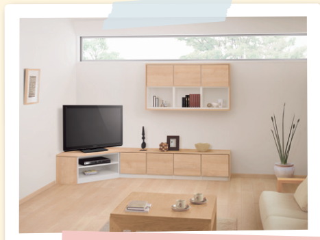
システム ファニチャー キュービオス