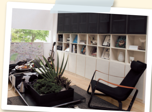
システム ファニチャー キュービオス