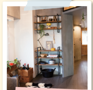
フレーム シェルフ