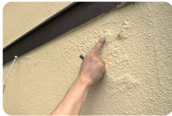
外壁の浮きやハガレをチェック。