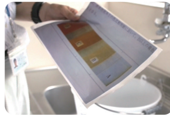
水回りの錆、作動状況をチェック。