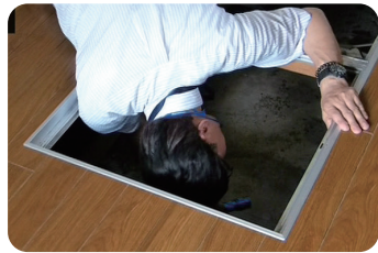
目の届きにくい場所もチェック

戸建てで最大17項目97箇所、見えないところまで細かく建築士がチェック。「被災しやすい災害」に備えるためにも、一度プロの目で点検しませんか？