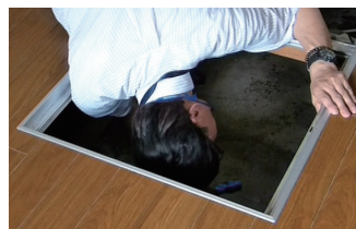
点検しにくい床下や小屋根、水廻りもチェック。