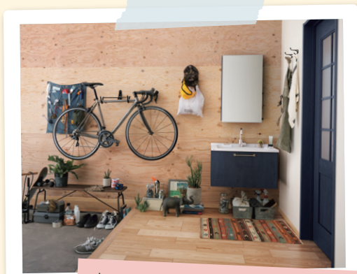
洗面 ドレッシング シーライン スタンダード D530タイプ

細かい砂も細菌も花粉も、サアーツとキレイに吹き飛ばしてくれるような“エア・シャワー”♡♡ な～んで、今日も子供たちや主人の汚れた衣服を洗濯機に突っ込みながら妄想している。