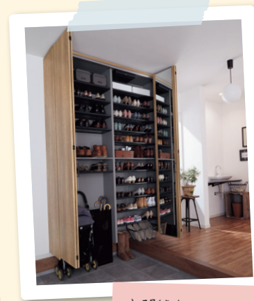
玄関用 収納 クロー ボックス

ナノイーXで花粉、ウイルス、PM2.5、 アレル物質、ニオイなど部屋の中の 有害物質をすばやく抑制してくれて、 同時に乾燥も防いでくれるから安心ね。