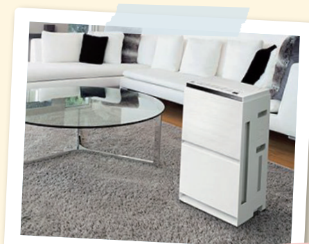
加湿 空気清浄機 F-VXV70

家に帰ってすぐに手洗い、うがいができる 玄関用の洗面台があれば、毎日の 習慣になりそう♡