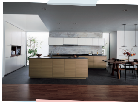
LE-CLASS II型 壁付け+ セミフロート アイランドプラン

これからは妻の“新しい城”で生まれた美味しい料理を日々楽しめると思うと、それが家族皆の、何よりの喜びなのだ。