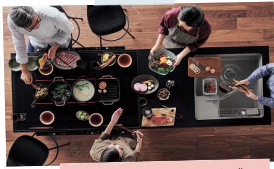
LE-CLASS Ironi Dining

家具のように美しくゆったりとした 収納。まるでステージのような 贅沢キッチンね♡