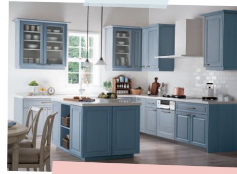
LE-CLASS L型 壁付け+ アイランドプラン

お友達とテーブルを囲んで、作り ながら食べるキッチンパーティ。 楽しいおしゃべりが美味しさを盛り 上げてくれそう！